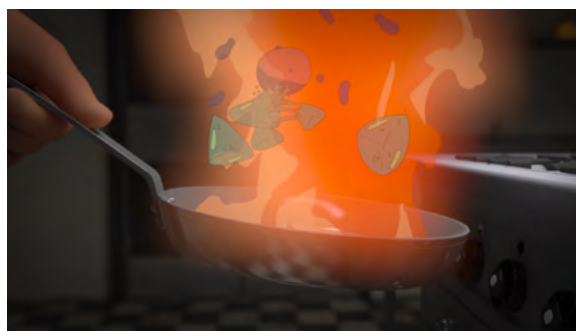
„Komposition VI – Eine Farbe des Geschmacks“ Gina Stephan (Regie, Animation), Matthias Strasser (Bildgestaltung/Kamera, Animation), Nicolas Sperling (Producer, Animation) – Filmakademie Baden-Württemberg